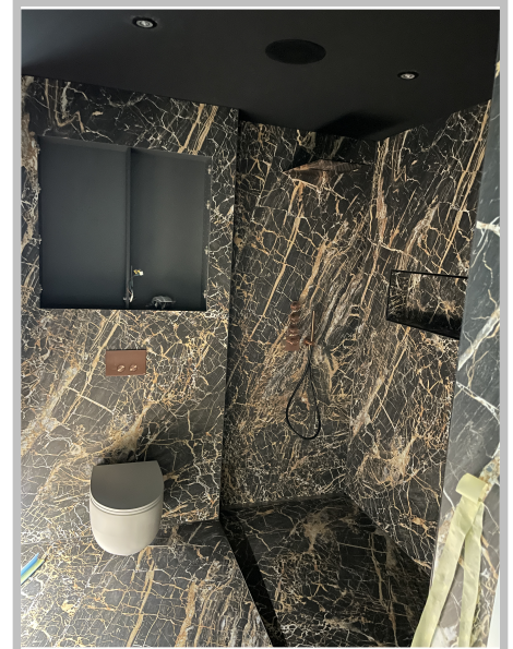
Dusch Installation im Bad