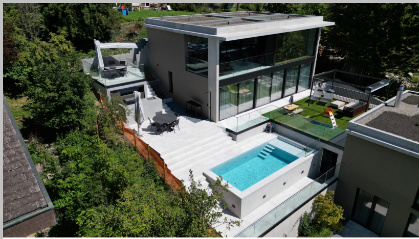
Frontal Ansicht auf das Gebäude